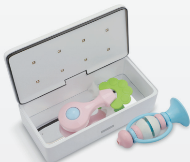
Petits jouets pour bébés