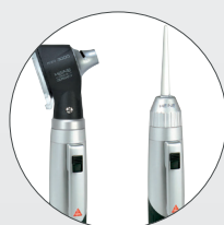
Otoscopes & Pousses coton