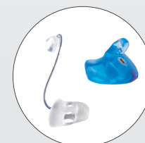
Embouts & Protections