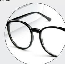
Lunettes de vue & solaires